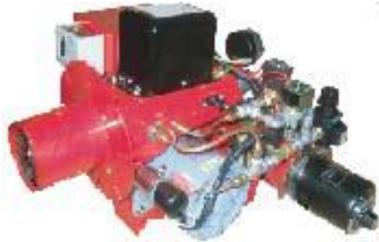
OMU型ハイブリッドバーナー